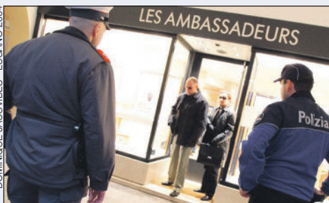
► La simulation d'attaque: un procédé initié par Sentinel Protection dans le cadre de ses formations de sécurité.

Au départ, l'entreprise s'illustre surtout dans la protection rapprochée et la présence de gardes dans les bijouteries. Actuellement, ce sont 11 prestations qui sont proposées. Outre la sécurisation des lieux sensibles et la protection des personnes, il existe un système de protection pour les enfants de personnalités importantes sans oublier la surveillance de sites, le gardiennage, le service d'huissiers personnalisé, le transport de valeurs et de fonds et même